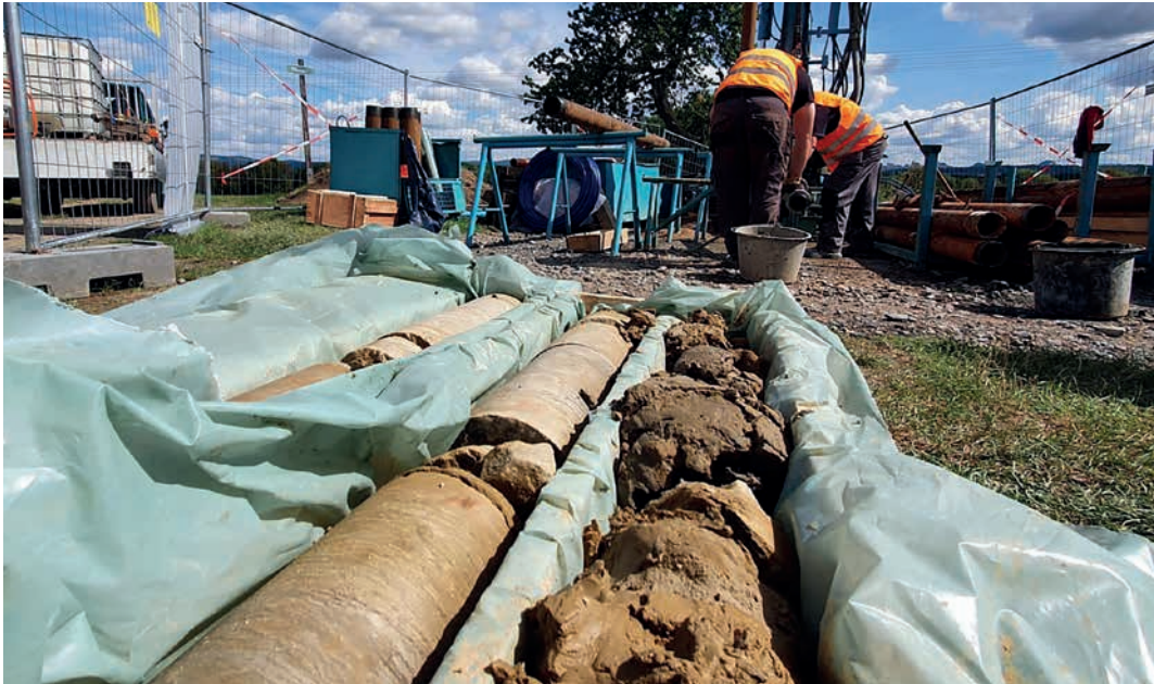
Erste Bohrungen haben im Sommer 2020 begonnen. Die Geologische Landesuntersuchung GmbH Freiberg wurde als Teil der ARGE „ErzTunnel“ durch die Deutsche Bahn AG mit der Durchführung von Bohrkernuntersuchungen im deutsch-tschechischen Grenzgebiet beauftragt.